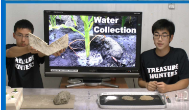
国際コンテスト(2020WEB開催)での発表