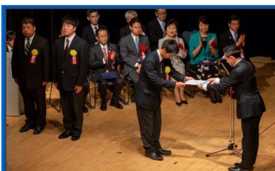
国内表彰式の様子