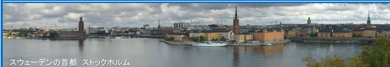
スウェーデンの首都 ストックホルム

2020ストックホルム青少年水大賞(国際コンテスト)において日本代表が“グランプリ”を獲得