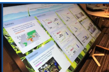
国際大会ではデジタルポスターを使用

2020ストックホルム青少年水大賞(国際コンテスト)において日本代表が“グランプリ”を獲得