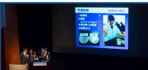
国内表彰式での発表