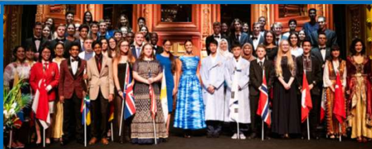
国際コンテストに参加する世界の仲間たち(現地開催時)