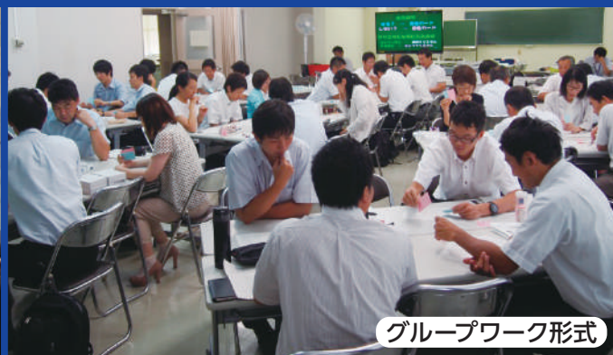
グループワーク形式